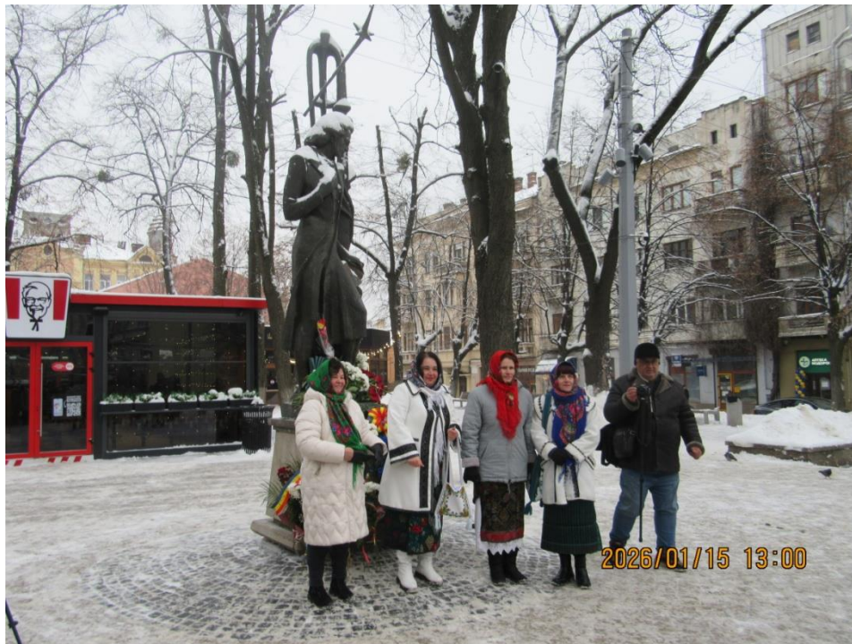
Cernăuți. 15.01.2026. Solemnitatea depunerii de flori la Monumentul „Mihai Eminescu”. A depus flori și un grup de membre din formația corală „Fetele din Bucovina” (alias „Armonia”), o subsidiară a celebrului cor nord-bucovinean „Dragoș Vodă”.